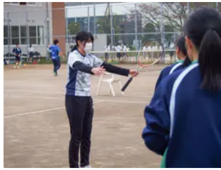
リーフラスの指導員に教わる生徒ら

スポーツスクール事業などを展開するリーフラスは数年前から、自治体などから業務委託を受けて、部活動の指導者などを配置する部活動支援事業に乗り出している。